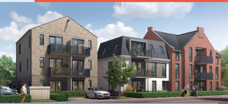
2-kamerappartementen met parkeerplaats in het centrum