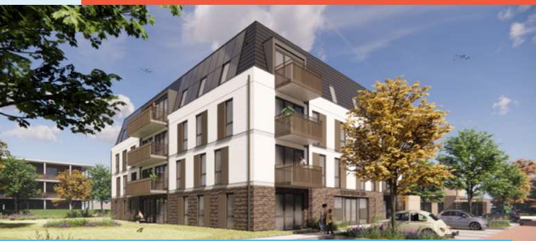
2- en 3-kamerappartementen voor sociale huur en middenhuur